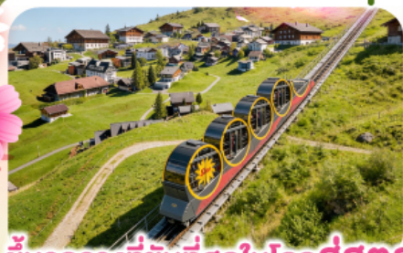
ชั้นรางที่ชันที่สุดในโลกสู่สตูล

พิชิตยอดเขาชุนเนกกา 1 ในเขาที่สวยงามที่สุดเมืองเซอร์แมท