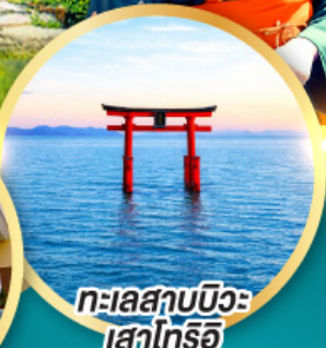
ทะเลสาบบิวะ เสาโทริอิ

เส้นทางสายอัลไพน์ทากายามา กำแพงหิมะ เขื่อนคุโรเบะ