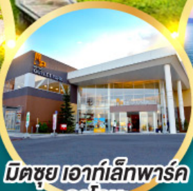
มีตชยุเอากะอิเคฮาร์ค คาโดมะ