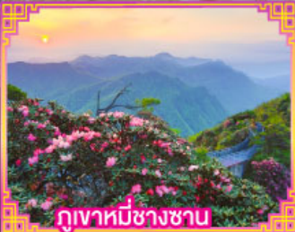
ภูเขาหมีซางซาน