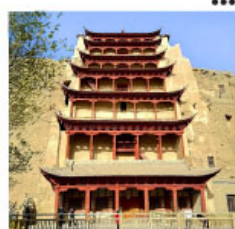
ถ้ำม่อเกา