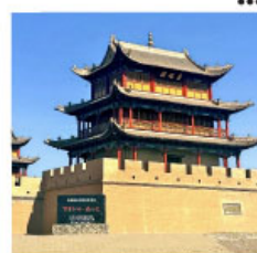
กำแพงเจียยี่กวน