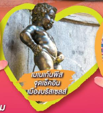
เมเนกันฟิส จุดเซ็คอิน เมืองบรัสเซลส์