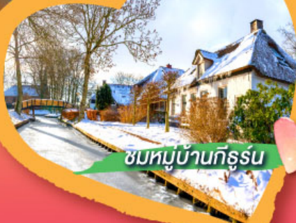
ชมหมู่บ้านกิธูร์น