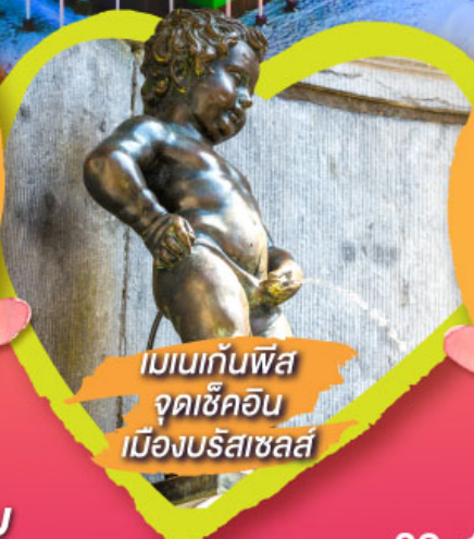
เมเนกันพิส จุดเช็คอิน เมืองบริสเซลส์