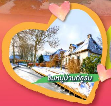
ชมหมู่บ้านกิธูรน