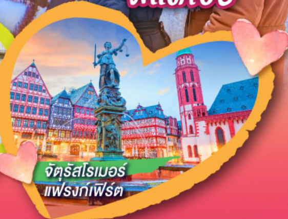
จัตุรัสโรเมอร์ แฟรงก์เฟิร์ต