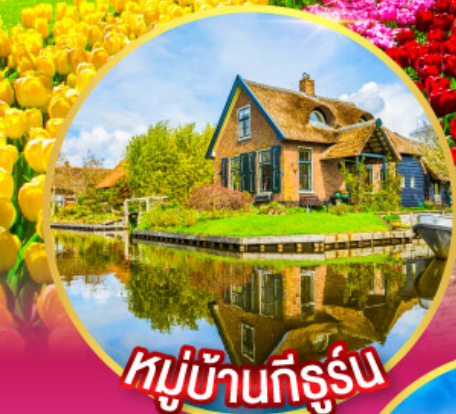
หมู่บ้านที่รูรัม