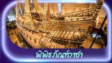
พิพิธภัณฑ์ทว่าซา