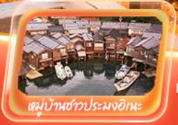
หมู่บ้านชาวประมงอิเกะ