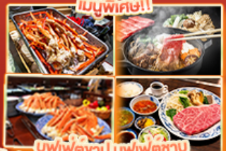
บุฟเฟ่ต์ญี่ปุ่น สเต๊ก Kobe