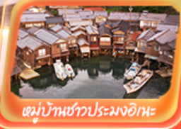
หมู่บ้านชาวประมงอิเะ