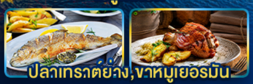
ปลาเทราต์ย่าง, จานหมูเยอรมัน

Season Germany Austria Czech of romance.. Slovenia Hungary