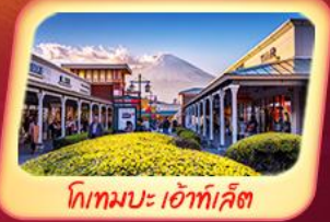
โทเทมบะ เอ้าท์เล็ต