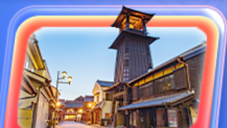
คาวาโกเอะ