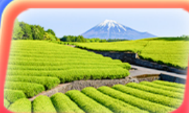
ไร่ชาที่โอบุจิ ชะชะปะ

ฟูจิออนเซ็น 1 คืน โตเกียว 1 คืน นาริตะ 1 คืน