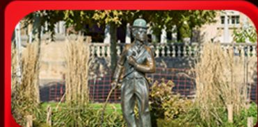
ชาร์ลี แชปลิน