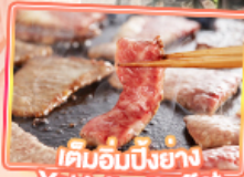
เค็มอัมบิงย่าง Yakiniku Buffet