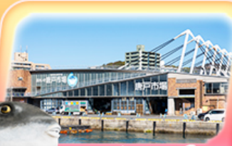
ตลาดปลาอาราโตะ

✈️ สายการบิน Vietjet Air (VZ) น้ำหนักกระเป๋า 20 KG vietjetair.com