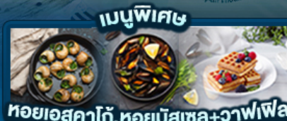
เมนูพิเศษ หอยเอสคาโก้, หอยมัสเซล+วาฟเฟิล

พิเศษ ล่องเรือแม่น้ำเซน ชมเมือง โดย บาโต มูช