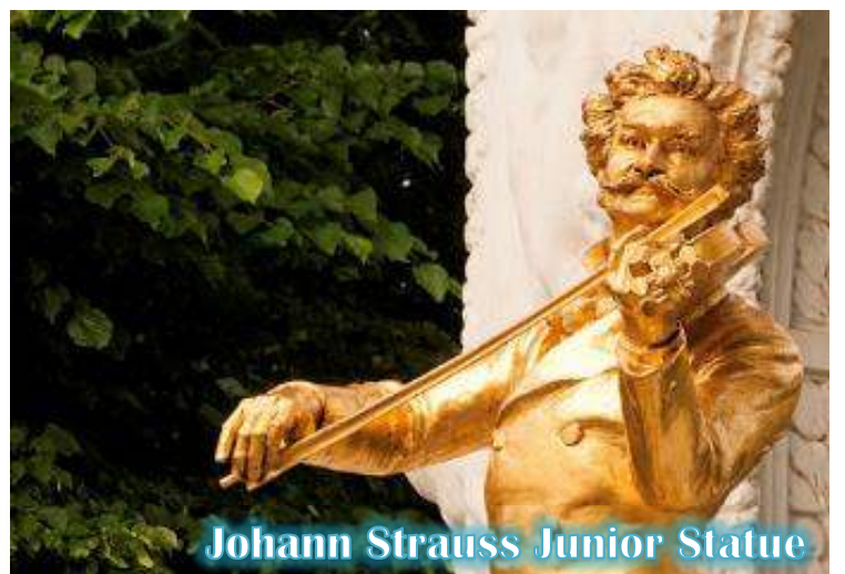
Johann Strauss Junior Statue

เช้า บริการอาหารเช้า ณ ห้องอาหารของโรงแรม นำท่านออกเดินทางเข้าสู่ใจกลาง _____ “กรุง เวียนนา” (Vienna) ผ่าน“ถนนวงแหวน” Ring Strasse ซึ่งเป็นที่ตั้งของ โรง อوبرาการ (โอเปราเฮาส์), พระราชวังฮอฟบวร์ก, อาคาร รัฐสภา, ศาลาว่าการ, มหาวิทยาลัยเวียนนา, โบสถ์ประจำเมือง, ศาลสูง ฯลฯ เดินทางสู่ “สวนสาธารณะสตัดท์ปาร์ค” สวนสาธารณะอัน ร่มรื่นใจกลางเมือง ชม “ อนุสาวรีย์ โยฮัน สเต ร่าส์ จูเนียร์ ” Johann Strauss ศิลปินที่มี ชื่อเสียงก้องโลก