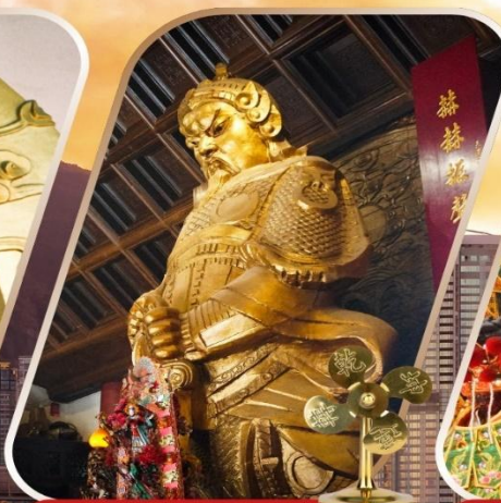
CHE KUNG (SHA TIN)