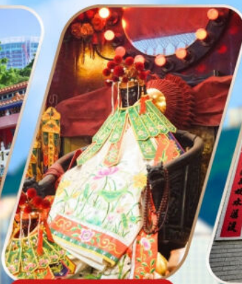
KWAN YUM HH