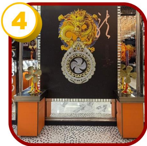
ศูนย์ฮวงจู้กั๊งหัน