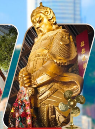
CHE KUNG (SHA TIN)