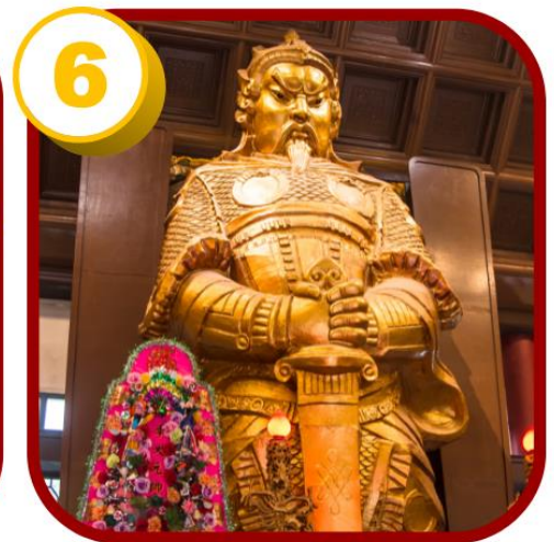
วัดแชกง (ซ่าถิ้น)