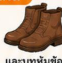
และบูทหุ้มข้อ