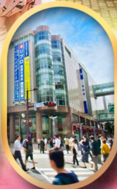
ช้อปปิ้งย่านเท็นจิน