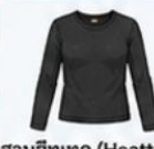
สวมฮีทเทค (Heattech) แบบหนาพิเศษด้านใน