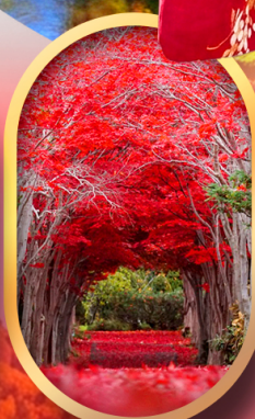
สวนฮิราโอกะ