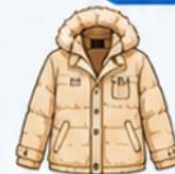
เสื้อโค้ทกันหนาว ตัวหนา