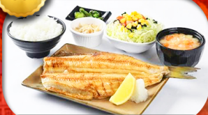
เมนูพิเศษ Set ปลาซอกเกะ