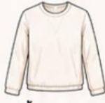
เสื้อแขนยาว