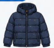
เสื้อขนเป็ด