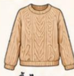
เสื้อไหมพรม