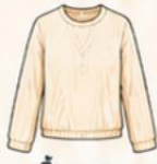
เสื้อแขนยาว