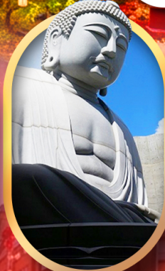
พระใหญ่อะตะมะ