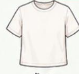
เสื้อยืด