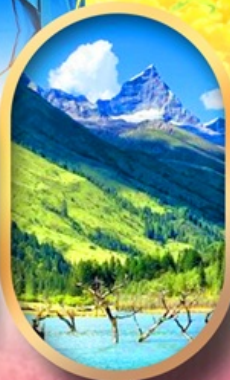
อุทยานสี่ตรุณี