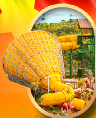
สวนน้ำ Hon Thom