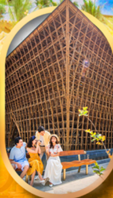
อาคารไม้ไฟ