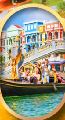
เอนิเมชั่นเวียดนาม