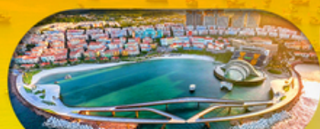
Kiss Bridge สะพานจูบ รวมค่าเข้าสะพานจูบแล้ว