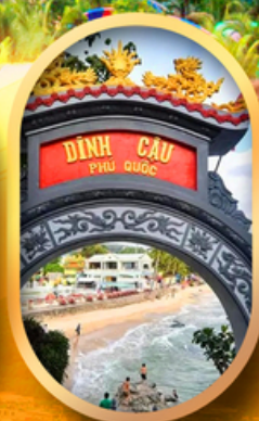
ศาลเจ้าดิงเกา