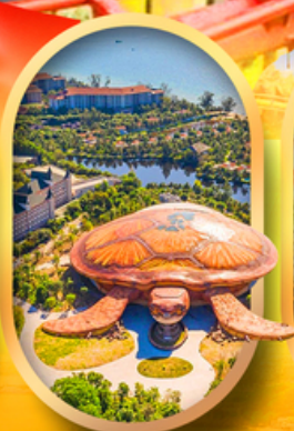
พิพิธภัณฑ์สัตว์น้ำ