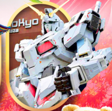
ห้างไอโดบะกันดั้ม