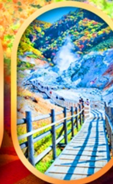
หุบเขานรกจิกุคคาบิ