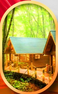
นิงเกิ้ลทอเรีย