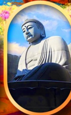
เบ็นเนาแห่งพระพุทธรเจ้า