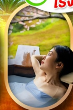
แช่ออนเซ็นญี่ปุ่น