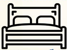
4.5-5ฟุต 1เตียง

ห้องพักเตียงดับเบิล DOUBLE BED ROOM (DBL)