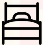
3.5-5ฟุต 1เตียง

ประเภทห้องพัก (เด็กอายุตั้งแต่6ปีขึ้นไป ต้องใช้เตียง) โปรดทำความเข้าใจในรายละเอียดห้องพัก **ห้องพักต่างประเภทอาจไม่ได้อยู่ในชั้นเดียวกัน**