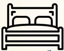
4.5-5ฟุต 1เตียง

ห้องพักเตียงดับเบิล DOUBLE BED ROOM (DBL)