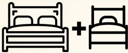
1เตียงใหญ่+1เตียงเสริม

ห้องพักสำหรับ 2 ท่าน ห้องพักมีจำนวนน้อย และมีขนาดห้องเล็กกว่า ห้องTWN