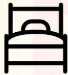
3.5-5ฟุต 1เตียง

ประเภทห้องพัก (เด็กอายุตั้งแต่6ปีขึ้นไป ต้องใช้เตียง) โปรดทำความเข้าใจในรายละเอียดห้องพัก **ห้องพักต่างประเภทอาจไม่ได้อยู่ในชั้นเดียวกัน**