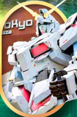
ห้างไอโดะกันดั้ม