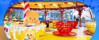
Fuji Q Highland x Butterbear เดินทาง พ.ศ. 69 เป็นต้นไป