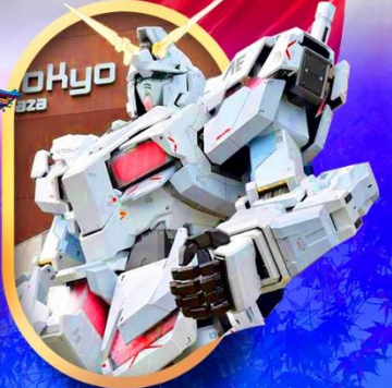
ห้างไอโดปะกันดั้ม