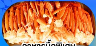
อาหารมือพิเศษ บุฟเฟ่ต์งาปู