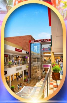
มิตซุยเอจิกะเออิ