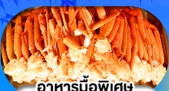
อาหารมือพิเศษ บุฟเฟ่ต์จางุ