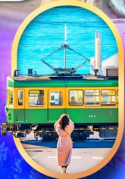
ถนนโคมาจิโดริ