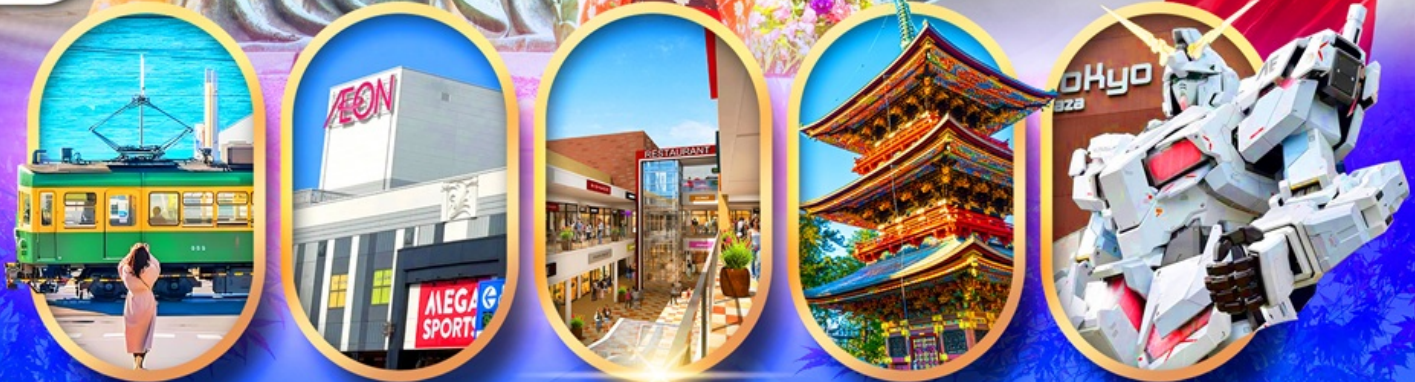
ถนนโคมาจิโดริ อีออนมอลล์ มิตซูเอ้าท์เล็ต วัดนาริตะจิน ห้างไอโดะกันดั้ม