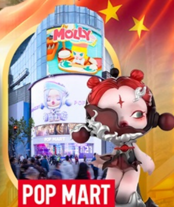
ช้อปปิ้งร้าน Pop Mart