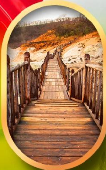
หุบเขาจิกุกุคานี