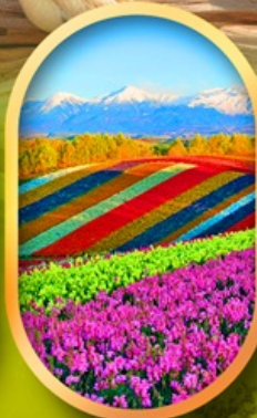
สวนดอกไม้ชิชิโซ