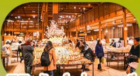
พิพิธภัณฑ์กล่องดนตรี Otaru Music Box Museum