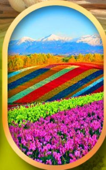
สวนดอกไม้ชิชิ