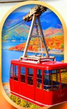
ขึ้นกระเช้าทะเลสาบมิกะตะ