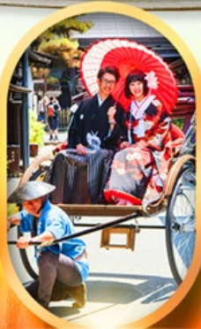
เมืองเก่าทาคายามา