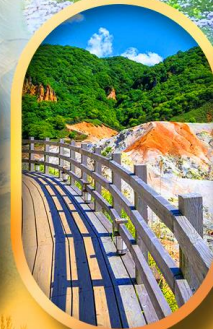
โนโบริเบ็ตสึ