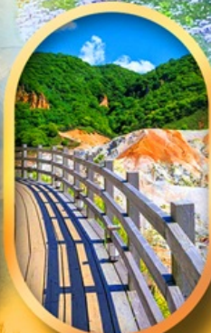
โนโบริเบ็ทสึ