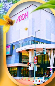
อ็อนมอลล์