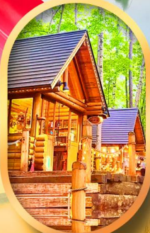
นิงเกิลเทอเรส