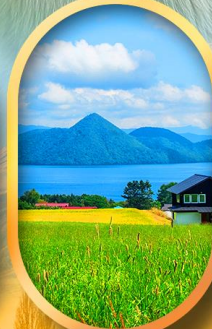
ทะเลสาบโทโยะ