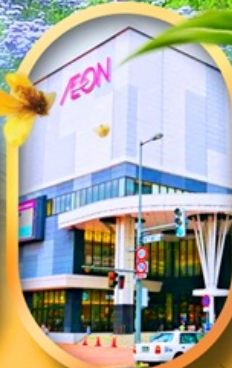
อ็อนมอลล์