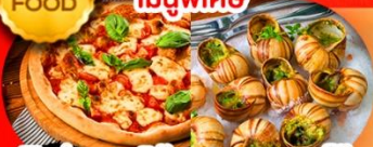
พิซซ่ามาริตต้า หอยแครงสด