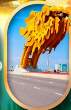
สะพานมังกรคานัง