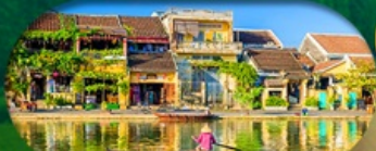
HoiAn Ancient Town ย่านเมืองเก่าฮอยอัน