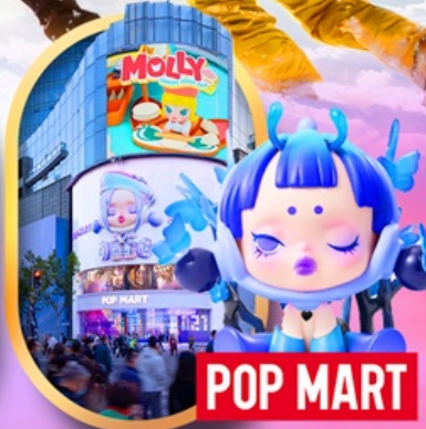
ถนนหนานจิง