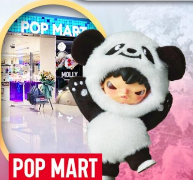
ช้อปปิ้งร้าน Pop Mart