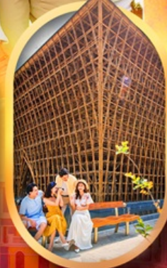
อาคารไม้ไผ่