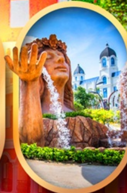
น้ำตกเทพพิหลิง