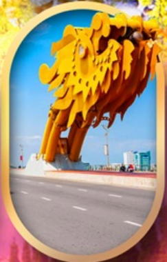
สะพานมังกรดานัง