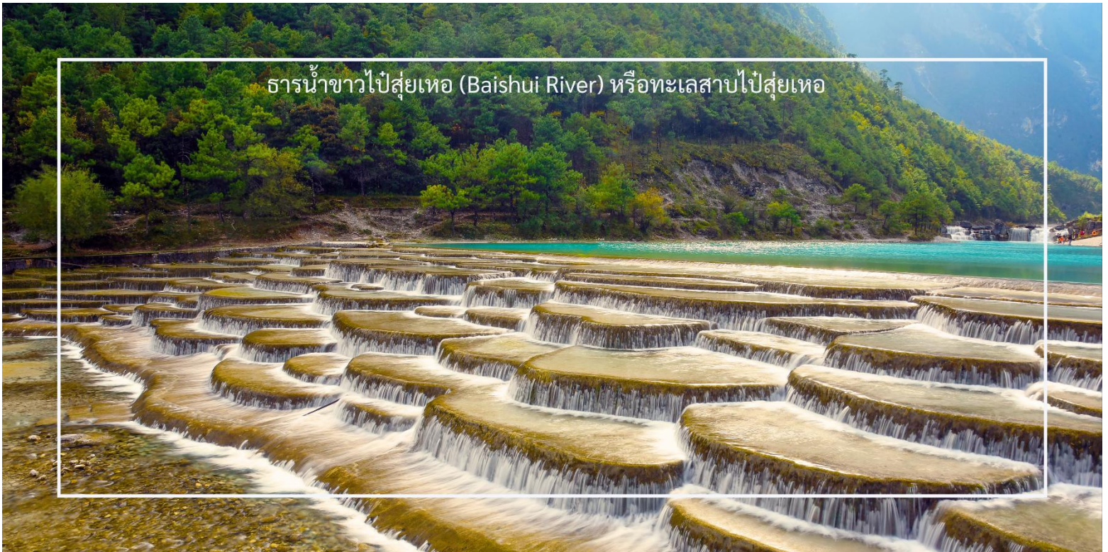
ธารน้ำขาวไป๋ส่วยเหอ (Baishui River) หรือทะเลสาบไป๋ส่วยเหอ

เที่ยวชม ทะเลสาบไป๋ส่วยเหอ (Baishui River) หรือทะเลสาบไป๋ส่วยเหอ หรืออีกชื่อหนึ่งคือ หุบเขาพระจันทร์สีน้ำเงิน (Blue Moon Valley) (รวมค่าบริการรถแบดเตอร์) เป็นสถานที่ท่องเที่ยวที่มีความงดงามทางธรรมชาติ ที่นี่คือทะเลสาบที่เกิดจากการละลายของหิมะบนภูเขาหิมะมังกรหยก มีน้ำใสสะอาดสะอาดสีเทอควอยซ์สะท้อนกับท้องฟ้าและภูเขารอบๆ เกิดธารน้ำตกหินปูนเล็ก ๆ ที่เรียงลดหลั่นกันขึ้น ๆ สวยงามจนเปรียบเสมือนสวรรค์บนดิน ทำให้เป็นสถานที่ที่เหมาะสมสำหรับการถ่ายรูปและพักผ่อนเป็นอย่างมาก