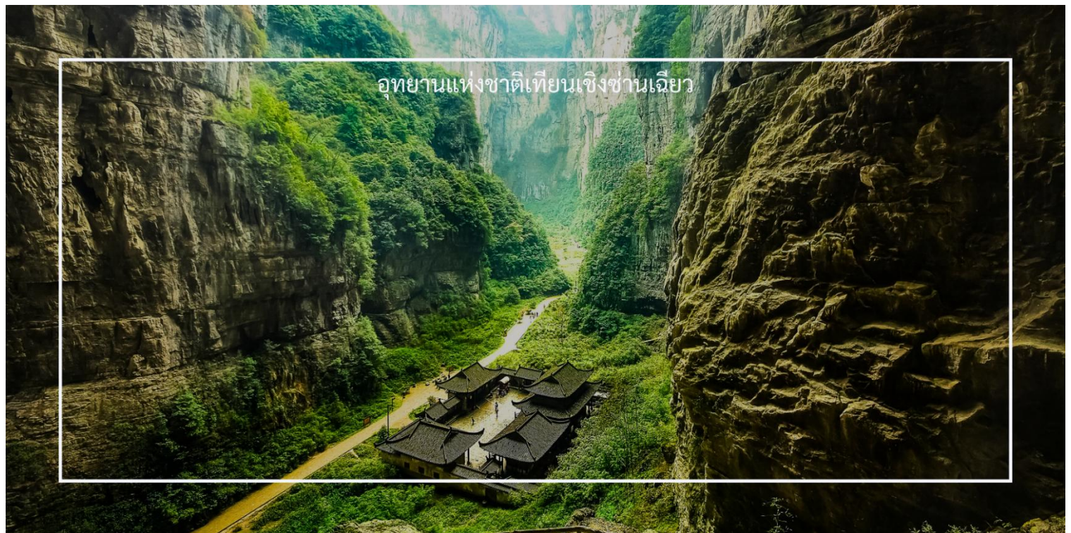
อุทยานแห่งชาติเทียนเซิงชานเฉียว

อุทยานแห่งชาติเทียนเซิงชานเฉียว (รวมลิฟท์แก้ว/รถภายในอุทยาน/รถไฟฟ้า) หรือที่เรียกกันว่า "หลุมฟ้า" เป็นอุทยานที่ตั้งอยู่ในประเทศจีน มีชื่อเสียงในด้านทัศนียภาพธรรมชาติที่งดงามและการอนุรักษ์สิ่งแวดล้อม ภายในอุทยานมีเส้นทางเดินป่าที่หลากหลาย ซึ่งนักท่องเที่ยวสามารถสำรวจธรรมชาติที่อุดมสมบูรณ์ รวมถึงภูเขา น้ำตก และป่าไม้ที่สวยงาม นอกจากนี้ยังมีโอกาสในการสังเกตสัตว์ป่าและพืชพันธุ์ที่หาได้ยาก