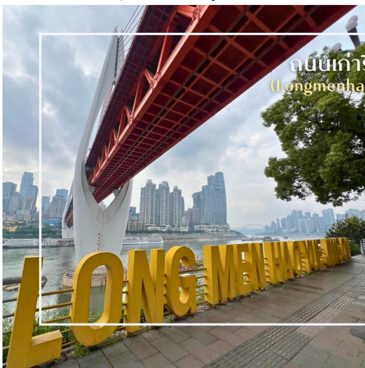
ถนนเก่าริมแม่น้ำ (Longmenhao Old Street)

นำท่านสู่ ถนนโบราณหลงเหมินฮ่าว (Longmenhao Old Street) ถนนเก่าริมแม่น้ำอีกหนึ่งแลนด์มาร์กสำคัญของเมืองฉงชิ่ง ถนนสายนี้เคยเป็นย่านการค้าและศูนย์กลางเศรษฐกิจที่รุ่งเรืองในยุคราชวงศ์หมิงและชิง ปัจจุบันได้รับการอนุรักษ์ไว้อย่างดี เพื่อเป็นแหล่งเรียนรู้ทางประวัติศาสตร์ และแหล่งท่องเที่ยวเชิงวัฒนธรรมที่เต็มไปด้วยเสน่ห์บรรยากาศของถนนยังคงอบอวลไปด้วยกลิ่นอายวันวาน อาคารบ้านเรือนแบบโบราณผสมผสานกับร้านค้า ร้านอาหาร และแกลเลอรีร่วมสมัยอย่างลงตัว อีกทั้งยังเป็นจุดชมวิวแม่น้ำที่โดดเด่น สามารถมองเห็นสะพานข้ามแม่น้ำแยงซีและทัศนียภาพของเมืองฉงชิ่งในมุมที่สวยงาม และอีกหนึ่งจุดหมายที่สะท้อนเสน่ห์ดั้งเดิมของที่นี่คือ Xiahaoli Old Street ตรอกซอกซอยแคบ ๆ บันไดหิน และสถาปัตยกรรมไม้โบราณที่ยังคงกลิ่นอายของวิถีชีวิตในอดีต แม้ในปัจจุบันจะได้รับการบูรณะและพัฒนาให้เหมาะกับการท่องเที่ยว ก็ยังคงรักษาบรรยากาศคลาสสิกเอาไว้ได้อย่างดี