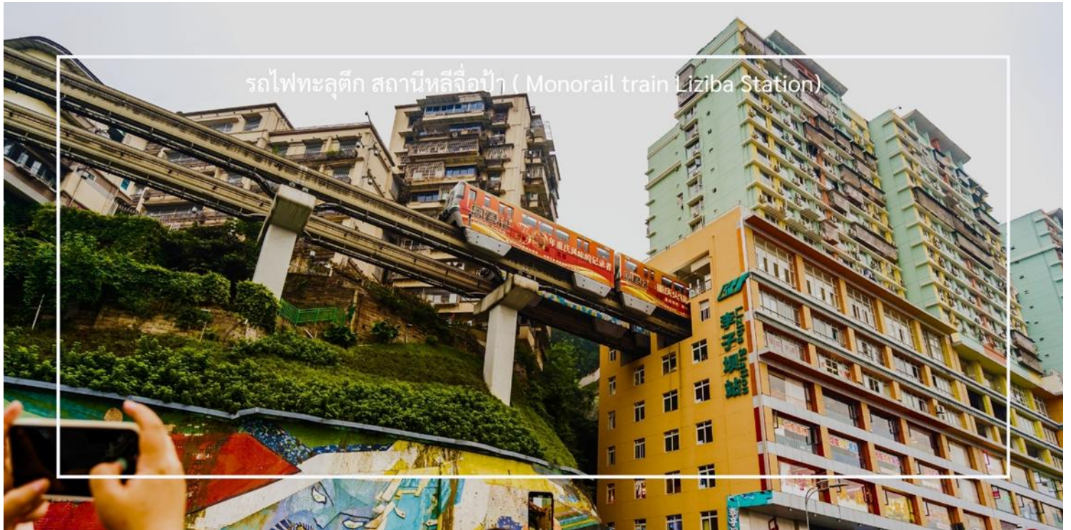
รถไฟฟ้าลูตึก สถานีหลี่จื่อเป่า (Monorail train Liziba Station)

ถ่ายภาพโมเมนต์สุดล้ำนี้จากมุมต่างๆ ของเมือง จุดชมวิวนี้นอกจากสร้างความตื่นตาตื่นใจ แต่ยังเป็นสัญลักษณ์ของการผสมผสานระหว่างเมืองสมัยใหม่กับภูมิประเทศที่มีภูเขาและแม่น้ำรายล้อม