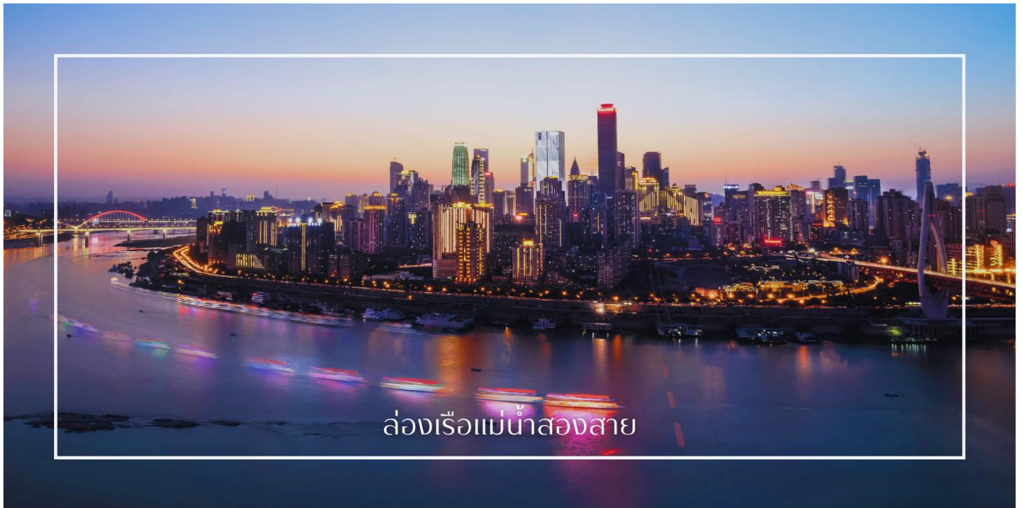
ล่องเรือแม่น้ำสองสาย