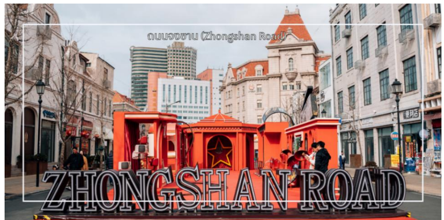
ถนนจงซาน (Zhongshan Road)

นำท่านเดินชมบรรยากาศบน ถนนจงซาน (Zhongshan Road) ถนนสายเก่าแก่ใจกลางเมืองชิงเต่า ที่เต็มไปด้วยเสน่ห์ของอาคารสไตล์ยุโรปยุคอาณานิคมและกลิ่นอายเมืองท่าริมทะเลอันคึกคัก ถนนสายนี้ถือเป็นย่านการค้าสำคัญในอดีต ปัจจุบันเต็มไปด้วยร้านค้า ร้านอาหาร คาเฟ่ และร้านของฝากท้องถิ่นให้เลือกซื้ออย่างเพลิดเพลิน