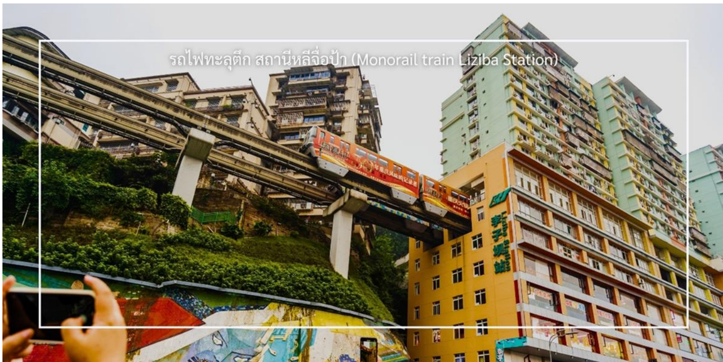
รถไฟทะลุตึก สถานีหลี่จื่อป้า (Monorail train Liziba Station)

ความหนาแน่นของประชากร การนั่งรถไฟทะลุตึกนี้เป็นวิธีที่ยอดเยี่ยมในการสัมผัสกับวัฒนธรรมเมืองฉงชิ่งและชื่นชมกับการพัฒนาเมืองที่น่าทึ่ง หากคุณมีโอกาสไปเยือนฉงชิ่ง อย่าลืมนั่งรถไฟเส้นนี้เพื่อสัมผัสประสบการณ์ที่ไม่เหมือนใคร