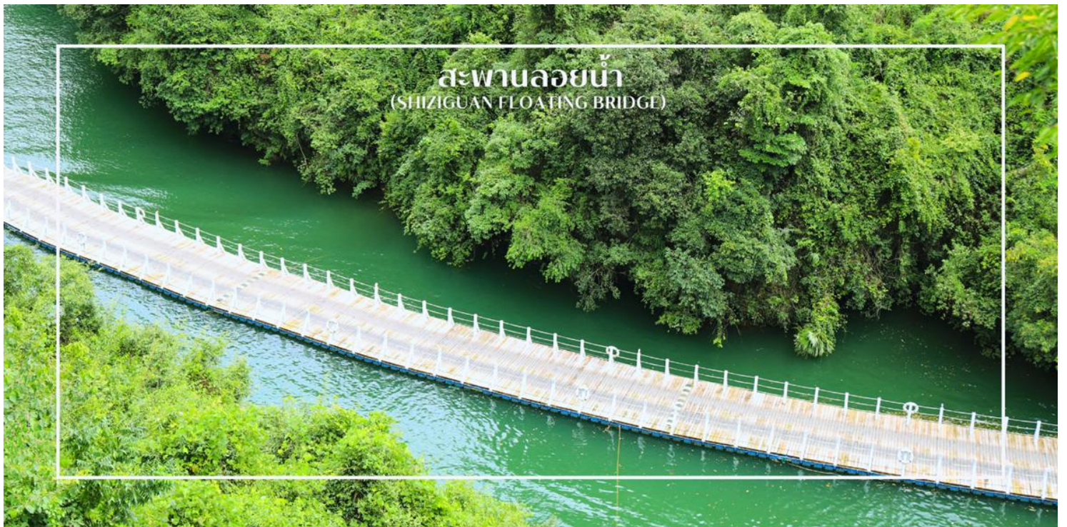
สะพานลอยน้ำ (SHIZIGUAN FLOATING BRIDGE)

จากนั้นนำท่านสู่ ซื่อจื่อกวน หรือที่รู้จักกันในชื่อ หุบเขาสิงโต เป็นแหล่งท่องเที่ยวทางธรรมชาติที่มีชื่อเสียง ตั้งอยู่ในเขตชวนเิน เมืองเินซือ ใกล้พื้นที่รอยต่อกับนครฉงชิ่ง สถานที่แห่งนี้โดดเด่นด้วยภูมิประเทศแบบหุบเขาลึก หน้าผาหินสูงตระหง่าน และแนวภูเขาที่มีรูปร่างคล้ายสิงโต จนกลายเป็นที่มาของชื่อ “หุบเขาสิงโต” ท่ามกลางธรรมชาติอันอุดมสมบูรณ์ ซื่อจื่อกวนได้รับการพัฒนาเป็นแหล่งท่องเที่ยวเชิงธรรมชาติที่ผสมผสานความงดงามของภูมิประเทศ วัฒนธรรมท้องถิ่น และกิจกรรมท่องเที่ยวที่น่าสนใจ พร้อมนำท่านสัมผัสประสบการณ์สุดตื่นเต้นและน่าจดจำ กับการนั่งรถข้าม “สะพานลอยน้ำซื่อจื่อกวน” (รวมค่ารถแบตเตอรี่) เส้นทางที่เหมือนลอยอยู่กลางน้ำ ชมวิวภูเขาและผืนน้ำระหว่างทางแบบเต็มตา