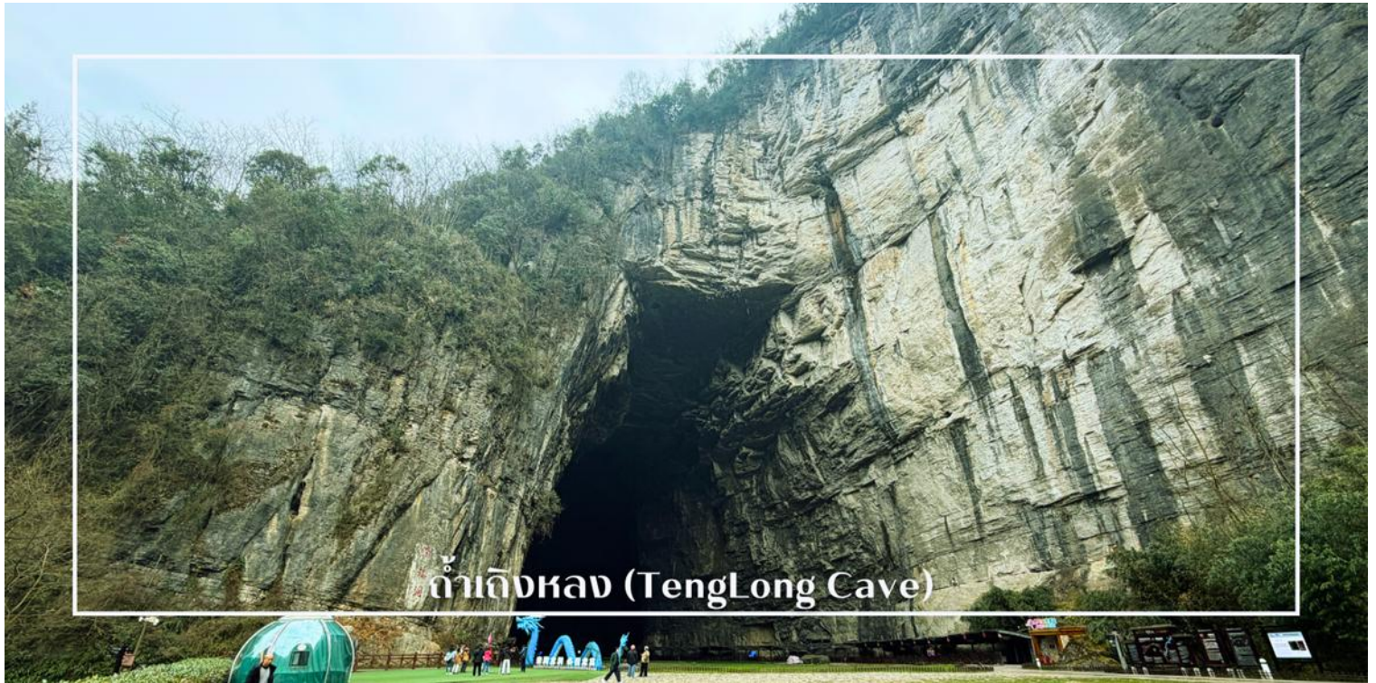
ถ้ำเอ็งหลง (TengLong Cave)