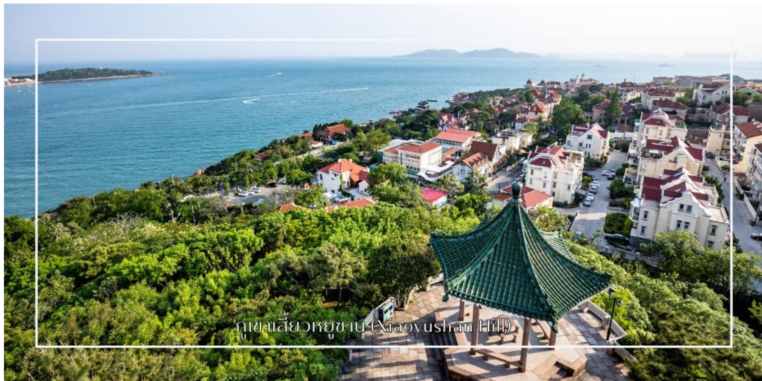
ภูเขาเลี้ยวหยูซาน (Xiaoyushan Hill)

นำท่านสู่ ภูเขาเลี้ยวหยูซาน (Xiaoyushan Hill) เนินเขาขนาดเล็กที่ตั้งอยู่ใจกลางเมืองชิงเต่า หนึ่งในจุดชมวิวที่งดงามที่สุดของเมือง จากยอดเขาท่านจะได้สัมผัสทัศนียภาพแบบพาโนรามาของชายฝั่งทะเล อาคารบ้านเรือนสไตล์ยุโรปหลังคาสี ส้ม โบสถ์เซนต์ไมเคิล และสะพานเจียวอวี่อันโด่งดัง ท่ามกลางอากาศบริสุทธิ์และสายลมทะเลพัดผ่าน