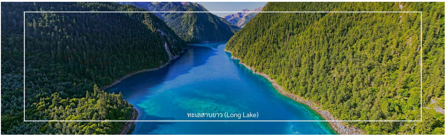
ทะเลสาบยาว (Long Lake)