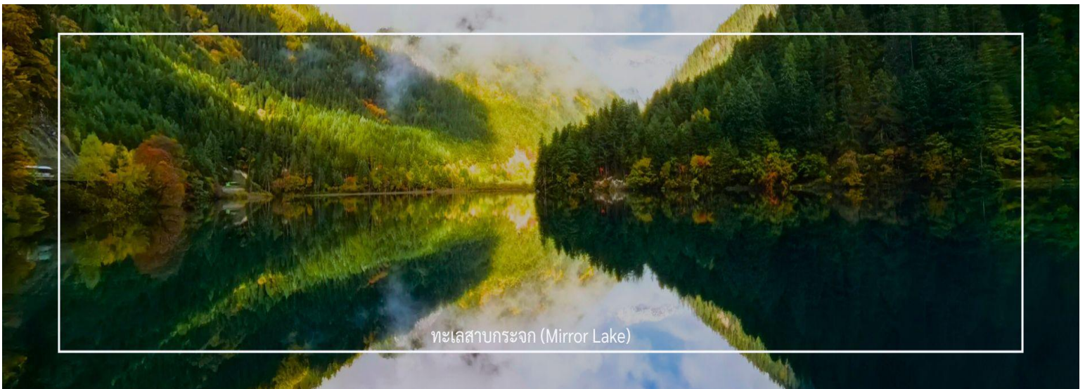
ทะเลสาบกระจก (Mirror Lake)

ทะเลสาบกระจก หรือ Mirror Lake ตั้งอยู่ในอุทยานแห่งชาติจิว่จ้ายโกว เป็นทะเลสาบที่ได้รับความนิยมในการถ่ายรูปมากที่สุดแห่งหนึ่ง เนื่องจากทะเลสาบแห่งนี้มีความกว้างมาก จึงสามารถสะท้อนภาพภูเขาและท้องฟ้าได้อย่างสวยงามราวกับกระจก ทะเลสาบกระจกมีความลึก 32 เมตร น้ำในทะเลสาบใสเป็นสีเขียว สามารถมองเห็นพื้นทะเลสาบได้