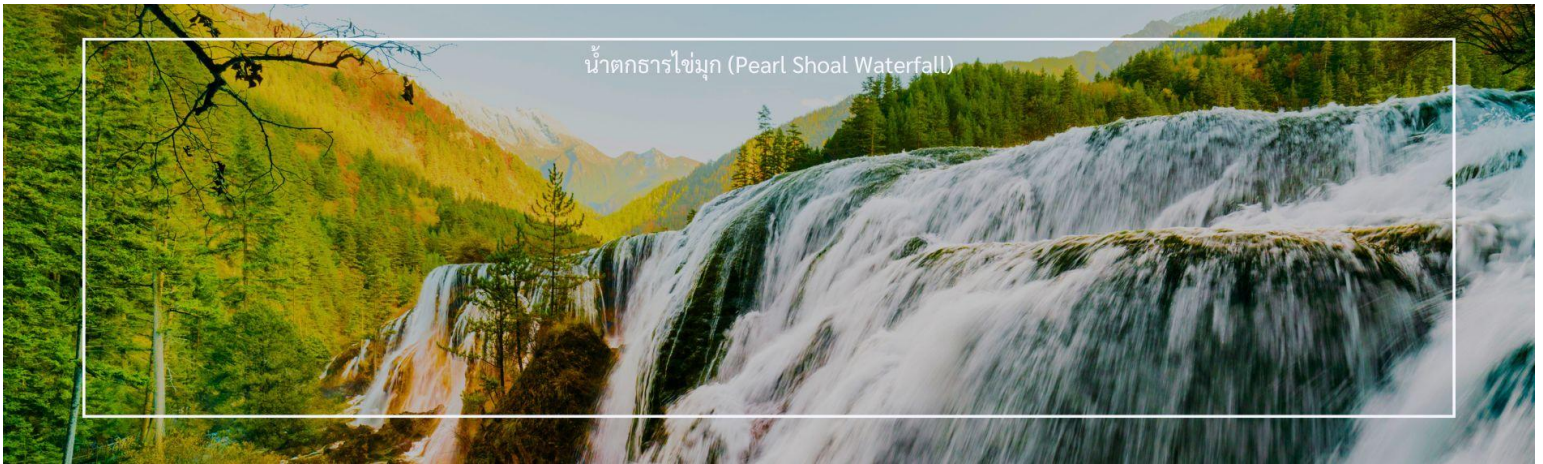
น้ำตกธารไข่มุก (Pearl Shoal Waterfall)

ชื่อของน้ำตกแห่งนี้มาจากรูปร่างของน้ำตกที่ไหลลงมาเป็นชั้นๆ คล้ายสายไข่มุกที่เปล่งประกาย น้ำตก Pearl Shoal เป็นน้ำตกที่ใหญ่ที่สุดในอุทยานแห่งชาติจิว่จ้ายโกว มีรูปร่างคล้ายพัด กว้าง 160 เมตร สูงจากระดับน้ำทะเล 2,433 เมตร น้ำไหลลงมายาว 310 เมตร นอกจากนี้ยังเคยเป็นสถานที่ถ่ายทำภาพยนตร์เรื่อง Journey to the West อีกด้วย