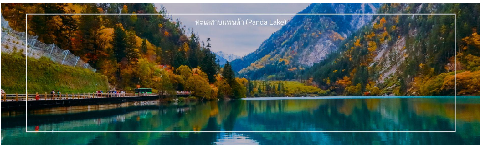
ทะเลสาบแพนด้า (Panda Lake)

เป็นหนึ่งในทะเลสาบที่สวยงามและโดดเด่นที่สุดในอุทยานแห่งชาติจิวจ้ายโกว ประเทศจีน ด้วยน้ำใสราวกับคริสตัลที่สะท้อนสีเขียวและน้ำเงินสลับกันไปมา พร้อมกับทิวทัศน์โดยรอบที่สวยงาม ทะเลสาบแห่งนี้จึงเป็นอีกหนึ่งจุดหมาย