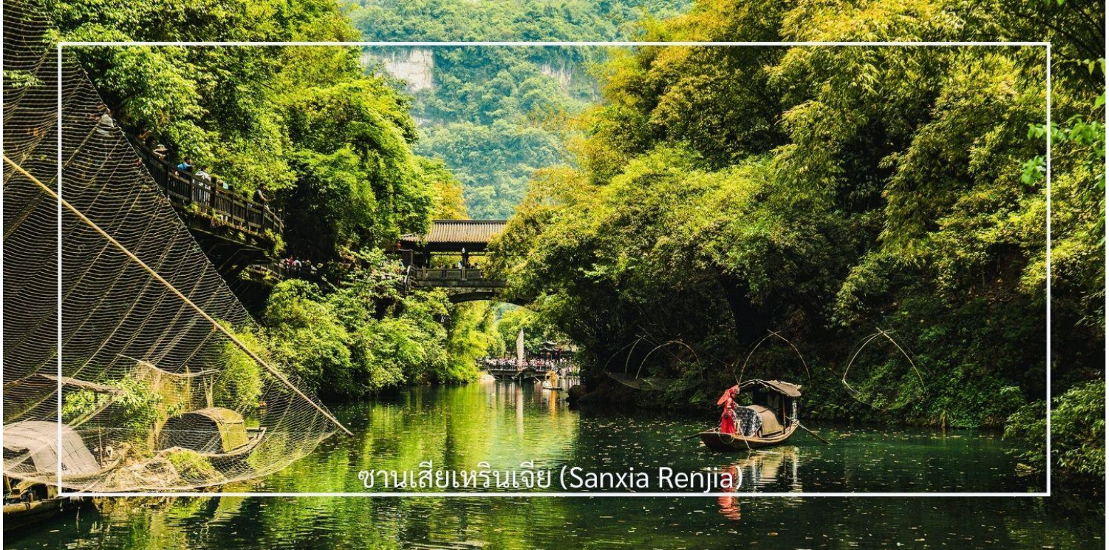
ซานเซียเหรินเจีย (Sanxia Renjia)

นำท่านสู่ หมู่บ้านซานเซียเหรินเจีย (Sanxia Renjia) (รวมล่องเรือ) สถานที่นี้เป็นที่รู้จักกันในชื่อ หมู่บ้านสามผา แหล่งท่องเที่ยวระดับ 5A ตั้งอยู่ในเขตหุบเขาสามผา ริมน้ำแยงซีเกียง โดดเด่นด้วยทัศนียภาพทางธรรมชาติอันงดงามของภูเขา หินผา สายน้ำ และหุบเขาที่โอบล้อมกันอย่างกลมกลืน สถานที่แห่งนี้สะท้อนวิถีชีวิตดั้งเดิมของชาวลุ่มแม่น้ำแยงซีเกียง ผ่านสถาปัตยกรรมพื้นบ้าน วัฒนธรรม ประเพณี ที่ยังคงเอกลักษณ์ไว้อย่างครบถ้วน พร้อมให้ท่านได้ชมการแสดงเรื่องราวเกี่ยวกับวิถีชีวิตควบคู่กับสายน้ำ