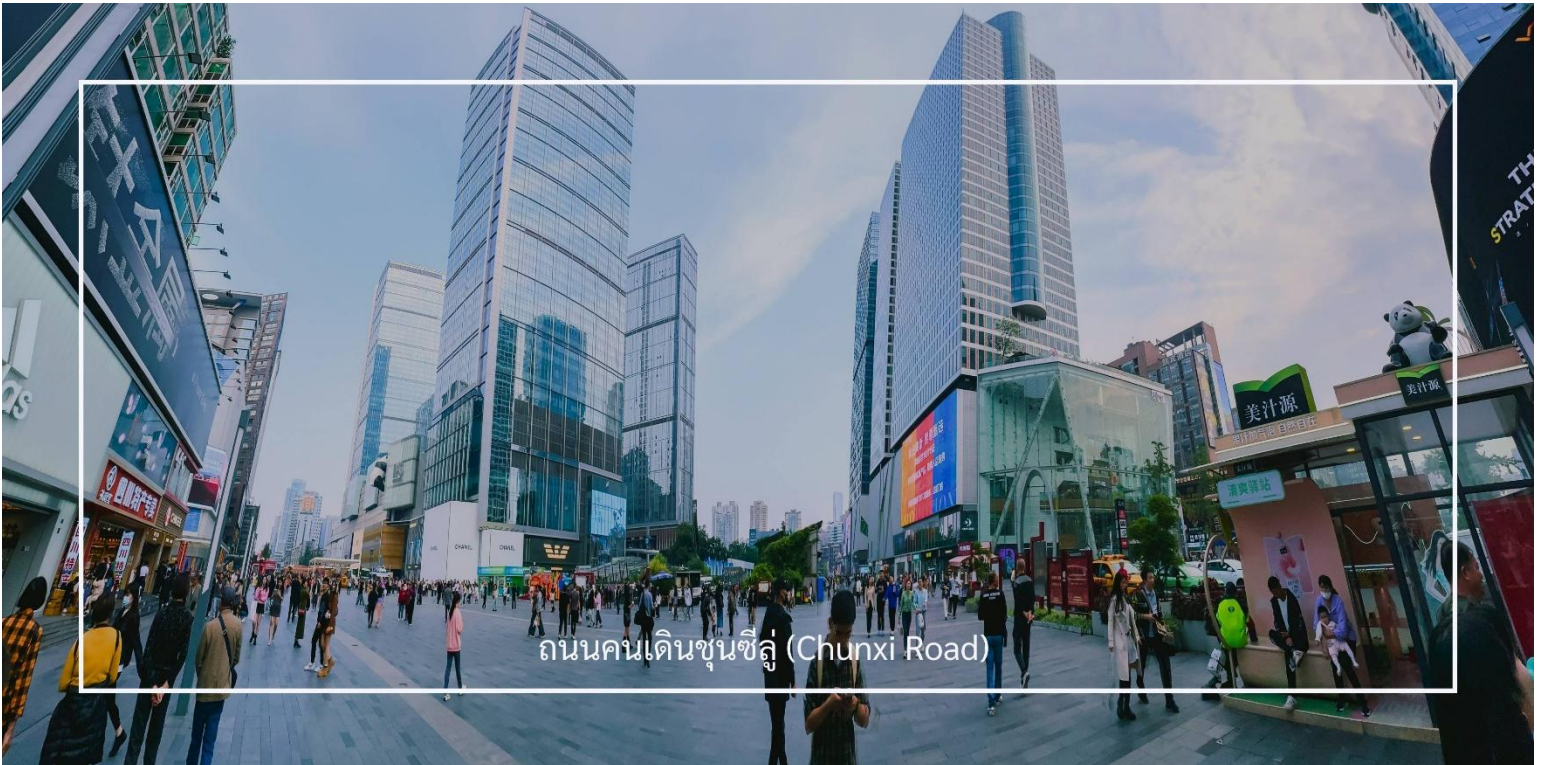
ถนนคนเดินชุนซีลู่ (Chunxi Road)

เดินข้ามถนนมาอีกหน่อย ท่านจะได้ซื้อป๊อง ถนนคนเดินชุนซีลู่ (Chunxi Road) เต็มไปด้วยร้านค้าแบรนด์ชั้นนำทั้งในและต่างประเทศ รวมถึงร้านเสื้อผ้าแฟชั่น รองเท้า อุปกรณ์อิเล็กทรอนิกส์ และของฝาก ถนนคนเดินชุนซีลู่เป็นจุดที่มีความคึกคักและเต็มไปด้วยผู้คน โดยเฉพาะในช่วงวันหยุดสุดสัปดาห์และเทศกาลต่างๆ คุณจะได้พบกับการแสดงศิลปะ การแสดงดนตรี และกิจกรรมที่น่าสนใจ มีร้านอาหารมากมายที่เสนออาหารท้องถิ่นและขนมหวานที่หลากหลาย นักท่องเที่ยวสามารถลิ้มลองเมนูพื้นเมืองที่อร่อย เช่น เสี่ยวหลงเปา (ซาลาเปานึ่ง) หรือขนมโบราณตามรอยซีรีส์จิ้นอย่าง มาโลโกว ก็มีเช่นกัน