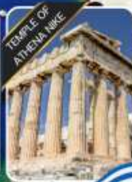
TEMPLE OF ATHENA NIKE