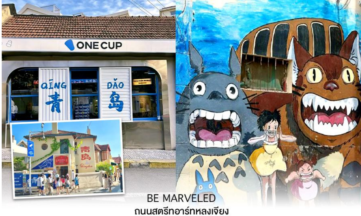
BE MARVELED ถนนสตรีอาร์ทหลงเจียง

จากนั้นนำท่านไปชม ทุ่งดอกฟิงค์มอส เป็นสวนดอกไม้ขนาดใหญ่ ในช่วงฤดูใบไม้ผลิทุ่งหญ้าจะปกคลุมไปด้วยดอกฟิงค์มอส ลักษณะของดอกฟิงค์มอสคล้ายดอกซากุระแต่บานบนพื้นดิน ออกดอกหนาแน่นสีชมพู ขาว และม่วง เป็นดอกไม้พุ่มเตี้ย ดอกขนาดเล็ก จะบานสะพรั่งเป็นพรมดอกไม้ เหมาะสำหรับการเดินเล่น ชมดอกไม้ ถ่ายรูป