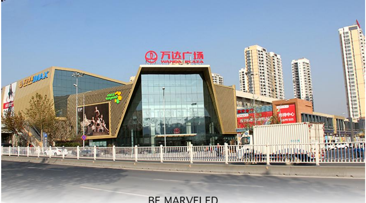
BE MARVELED ช้อปปังศูนย์การค้า (Qingdao Wanda Plaza)

ที่พัก HOLIDAY INN EXPRESS QINDAO หรือเทียบเท่าระดับ 4 ดาว