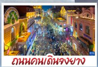
ถนนคนเดินจงยาง