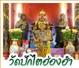
วัดปิกไต้ย่องฮ่า