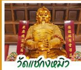
วัดเซ่งก้งหิว