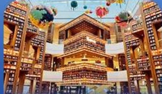
ต๋องกมุดคตารพีค