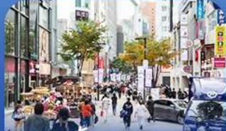
ช้อปบิงข่านเมียงดง