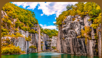
เขื่อนเขาดิกปะเมืองโพซอน

ตามหาใบไม้เปลี่ยนสีสุดโรแมนติก ชมวิวเมเปิ้ลหลากสีจากสะพานแวงรูปตัว Y แห่งเมืองโพซอน สัมผัสความงดงามของโพซอนอาร์ทวอลล์ • เดินเล่นท่ามกลางต้นแปะทิวและเมเปิ้ลในพระราชวังเคียงบกกรุงซมหมู่บ้านอันอกกลางบรรยากาศย้อนยุค และปิดท้ายด้วยทุ่งหญ้าสีทอง ณ สวนฮานิลแลนด์มาร์กยอดนิมของกรุงโซล ในช่วงฤดูใบไม้เปลี่ยนสีที่สวยงามที่สุด